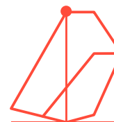
Pie 3/4 Espalda