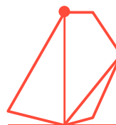
Pie 3/4 Frente

En el figurín de 3/4 espalda el pie de adelante será el que dibujaremos de perfil.